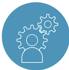
Kompleksowa inżynieria zorientowana na klienta