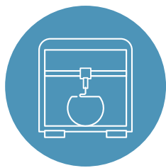
Zaawansowane technologie produkcyjne