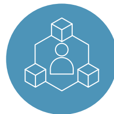
Organizacja skupiona na człowieku